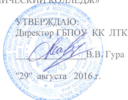
ГРАФИК ПРОХОЖДЕНИЯ ПРАКТИК студентами ГБПОУ КК ЛТК заочной формы обучения на 2016 – 2017 учебный год